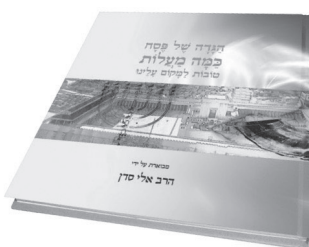
מהדורה שנייה של הגדה של פסח כמנהג בני ישראל טובות למקום עלינו עם הביאור של הרב אלי סדן