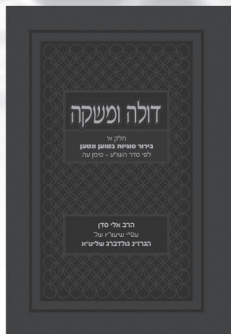
דולה ומשקה בירור סוגיות בסטוּן ונטען הרב אלי סדן