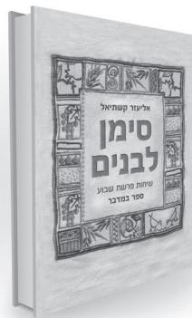
ספרים חדשים של סימן לבנים - רעיונות מחודשים ומאירים על ספרי בראשית ובמדבר הרב אליעזר קטשאל