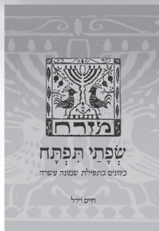
שפתי תפתח על תפילת שמונה עשרה הרב חיים וידל