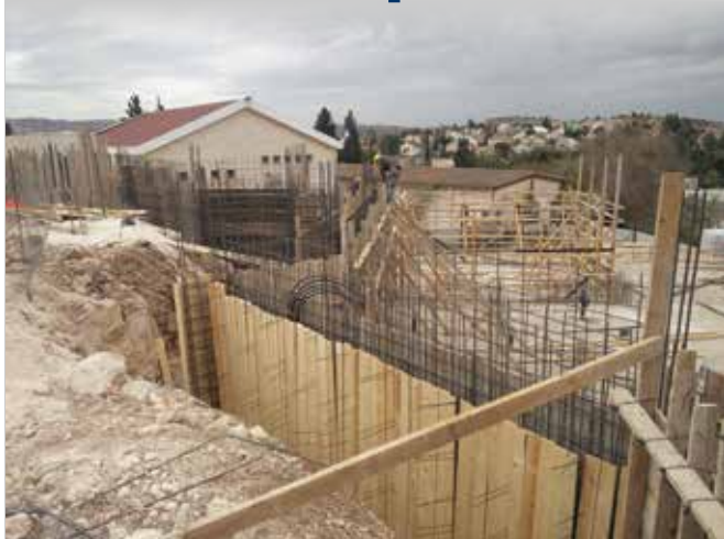
בשעה טובה נוצקו היסודות ובניית בית המדרש של המכינה החלה, והופקדה על המלאכה החברה לפיתוח מטה בנימין.

בני מחזורו של הדר ב' בני דוד' הכינו חופה מיוחדת, מעוצבת כעיצוב ההזמנה שעיצב הדר ז"ל לחתונתו שלצערנו לא התקיימה. תחת חופה זו נישאים בני מחזורו, ותחתיה הובילו בני המשפחה, רבני 'בני דוד' ובני משפחת פאליק את ספר התורה - עטור במעיל שגם עליו איורים מתוך ההזמנה - לבית המדרש של המכינה. לאחר הכנסת ספר התורה להיכל יצאו המשתתפים להניח אבן פינה למבנה בית המדרש והכיתות של מכינת 'בני דוד'. באירוע נשאו